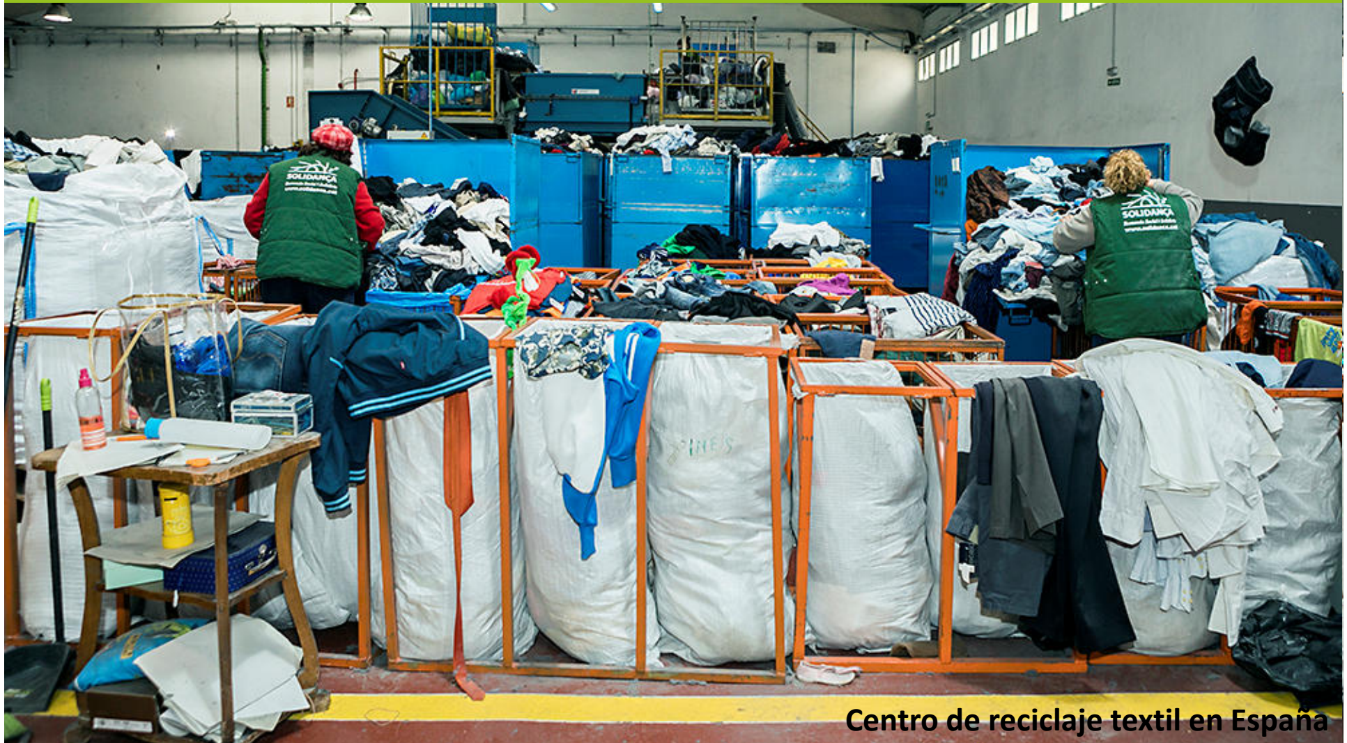
Centro de reciclaje textil en España